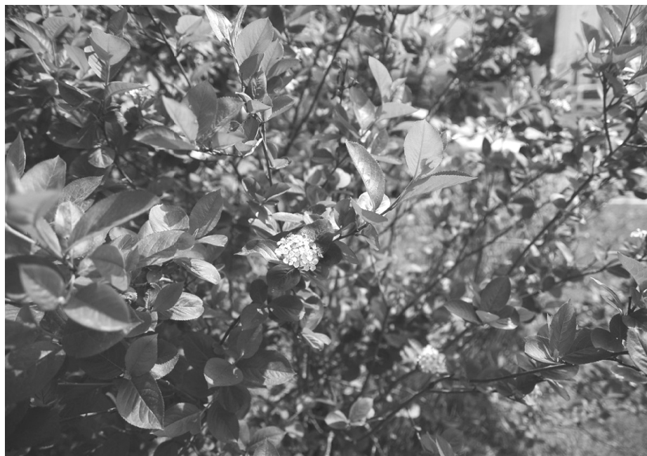
1-сурет. Қара жемісті шетен ( Aronia melanocarpa )

Зерттеу нәтижелері және талқылау. Қара жемісті шетен ( Aronia melanocarpa ) — раушангүлділер тұқымдасына жататын көпжылдық ағашты өсімдік. Биіктігі 10–15 м (1-сур.).