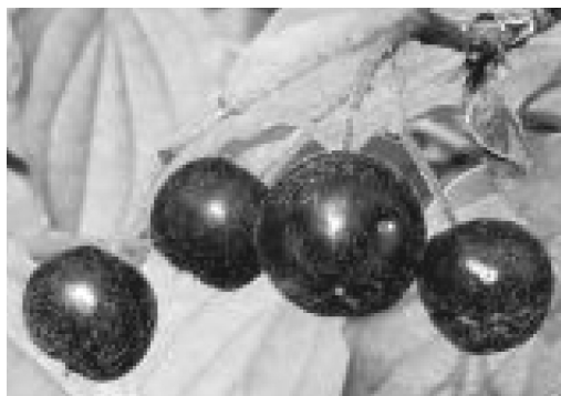
2-сурет. Қара жемісті шетен ( Aronia melanocarpa )