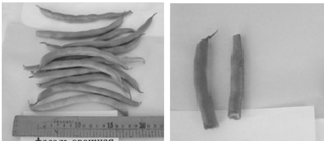
Рисунок 2. Фасоль овощная сортообразца «Montano» (Финляндия)

по качеству среди них являются те, у которых бобы продолжительный период не грубеют и не склонны к образованию пергаментного слоя и волокна в течение всего периода вплоть до уборки. Выделенные из коллекции образцы не только превосходили остальные по количеству зеленых бобов, но и соответствовали требованиям, предъявляемым к качеству боба (рис. 2).