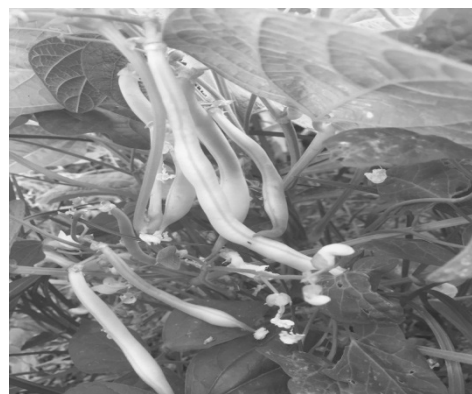
Б — фаза технической спелости