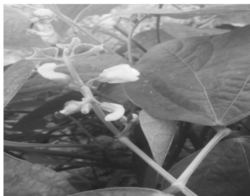
А — фаза цветения