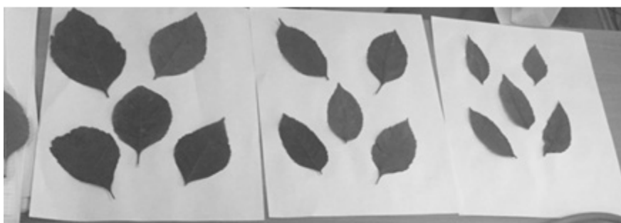
Сурет 1. Морфометриялық зерттеуге және флуориметр арқылы анықтауға алынған жапырақтар үлгілері

Төменде көрсетілген графиктерде орташа арифметикалық мәндері және стандартты орташа кателігі көрсетілген. Фотосинтетикалық аппараттың жұмысының тиімділігін бағалау үшін электронды тасымалдау процесінде фотосистемаларды құрайтын хлорофилл молекулаларының қозғау энергиясы қандай бөлігін пайдаланатынын білу маңызды.