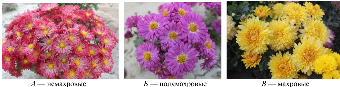
А — немахровые

Немаловажным признаком при оценке декоративности сортов хризантемы является махровость соцветия. По типу соцветий сорта хризантем в коллекции МЭБС представлены немахровыми, полумахровыми и махровыми соцветиями (рис. 1).