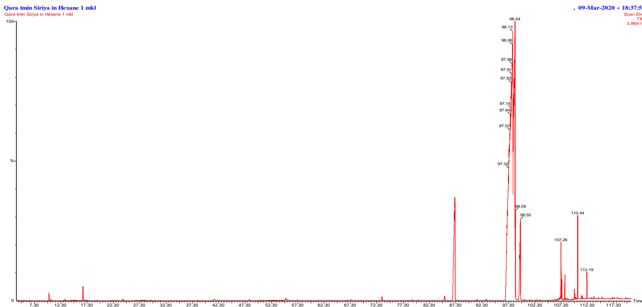
Рисунок 2. Хроматограмма масла черного тмина из Сирии